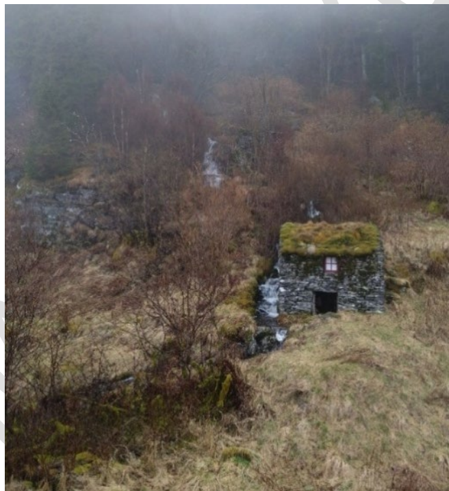
Kvernhus i stein på Skor.

Handmurt kanal som går frå Skor og renn ut i sjøen via ei stemme på Runnhovda. Bygd på pliktarbeid i samband med garveridrifta på Runnhovda, og forsynte garveria med kraft og vatn. Kanalen er om lag 3 km lang, og har mange bruer over seg, både større mura bruer og steinhellebruer. Viktige verdiar/kvalitetar å ta omsyn til: Samanheng frå fjell til sjø. Bruer over elva.