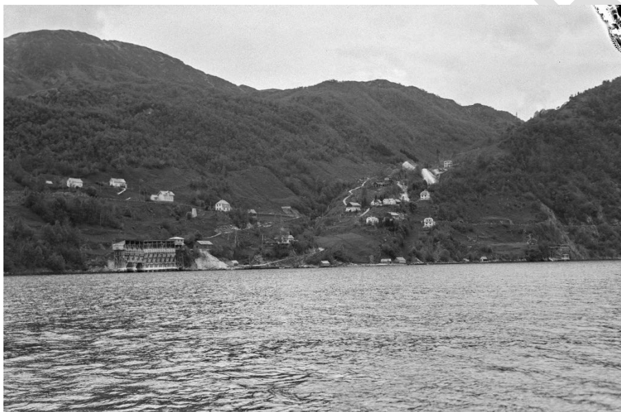
Gruvene på Skaftå, Atelier KK, 1939. Foto lånt av Billedsamlingen, UIB

Listeført kyrkje frå 1867, automatisk freda mellomalderkyrkjegard, prestegard, naustmiljø, prestekai, kyrkjegardsmur og friområde i Bruvik. Viktige verdiar/kvalitetar å ta omsyn til: Kyrkjemiljøet. Fasade på prestegarden. For meir informasjon, sjå kulturminnesok.no/83962 Vidareføring av omsynssone i noverande KPA.