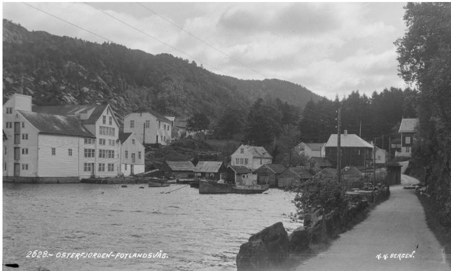
Fotlandsvåg sentrum, Atelier KK, mellom 1930 og 1932.