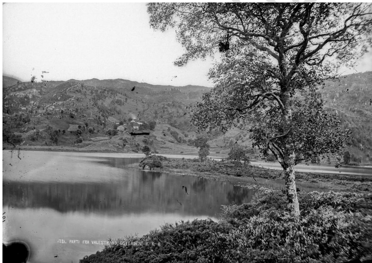
Knud Knudsen-foto av Brakvatne om lag 1871. Foto lånt av Billedsamlingen, UIB