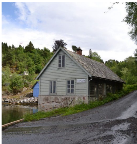
Meieriet på Teppstad.