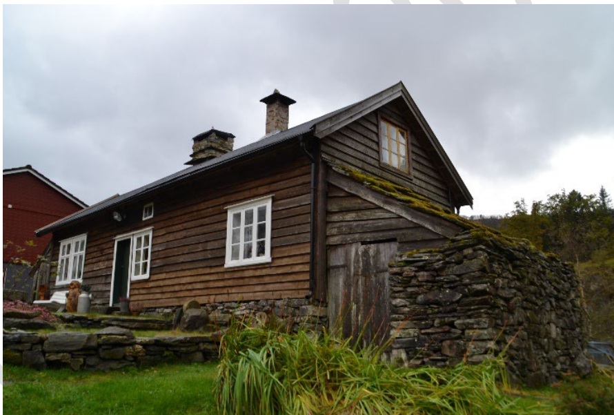
Bilete av lemstova på Koppen Gard.