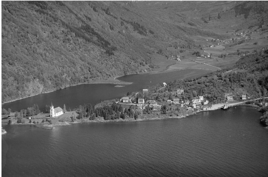
Haus sentrum og Mjelddalen, Widerøe's Flyveselskap AS, 1955.