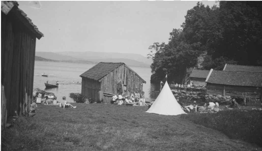
“Sole- og badeliv på Hamreplass, Osterøy” Oscar Hansen, frå mellom 1900 og 1905.

Vidareføring av omsynssone i noverande KPA.