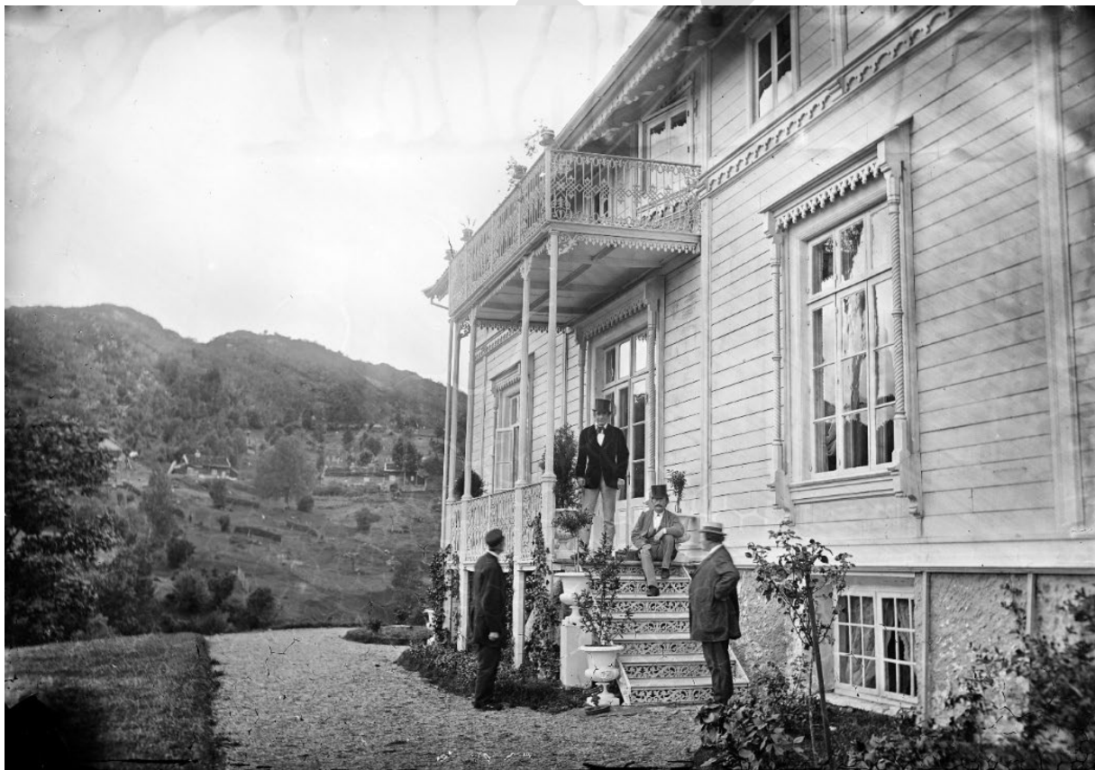
Knud Knudsen-foto av Bullahuset med Bakkjen i bakgrunnen, om lag 1870. Foto lånt av Billedsamlingen, UIB

Viktige verdiar og kvalitetar å ta omsyn til: Fasade og materialbruk på bustadhus, lør og uthus. Heilskapleg kulturlandskap.