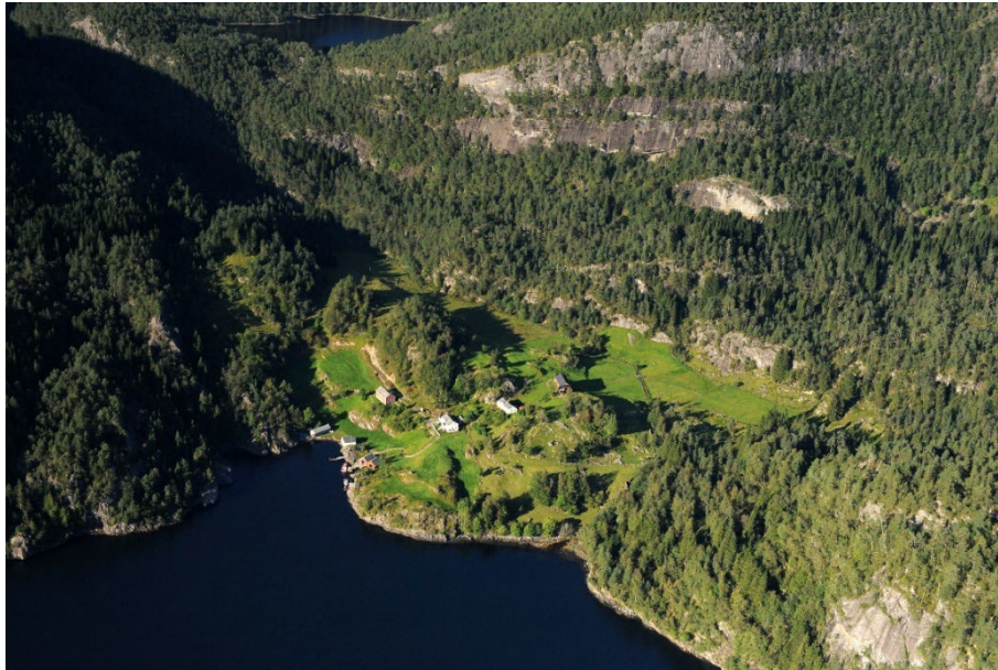
Heimvika - Nordhordland 2011 skråfoto - 50648796.