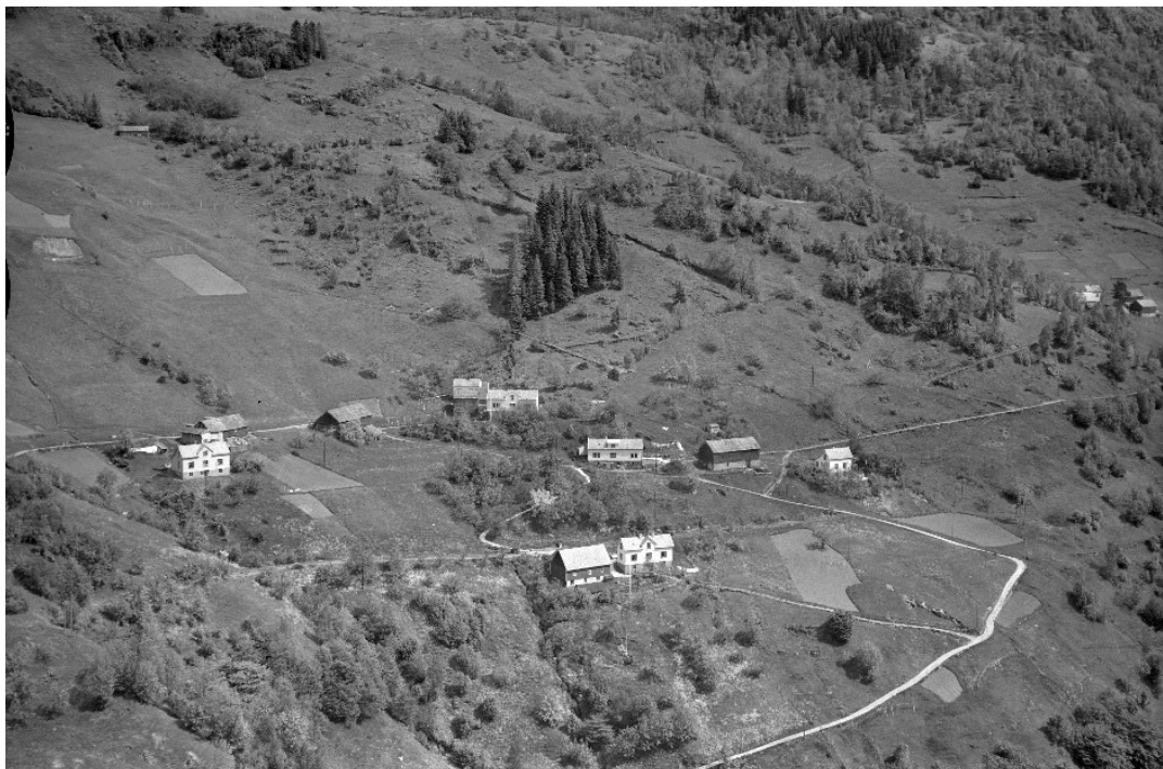
Blom, Widerøe's Flyveselskap AS, 1955. Foto lånt av Billedsamlingen, UIB