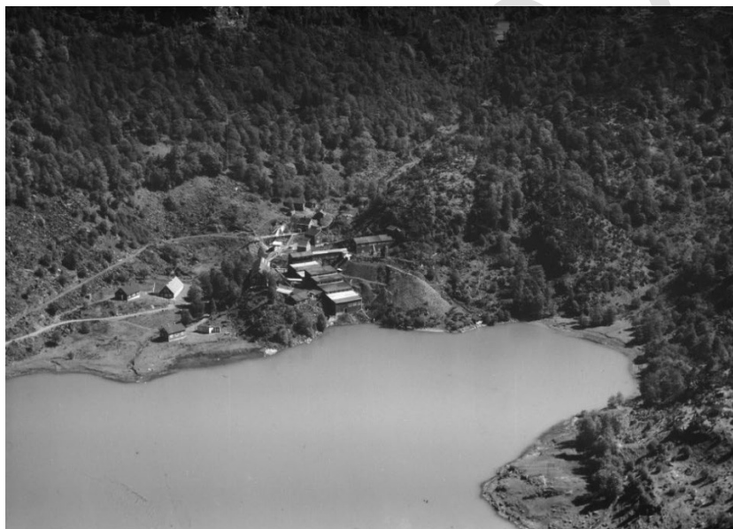
Litland Gruver, Widerøe's Flyveselskap AS, mellom 1935 og 1939.

For meir informasjon, sjå kulturminnesok.no/223095