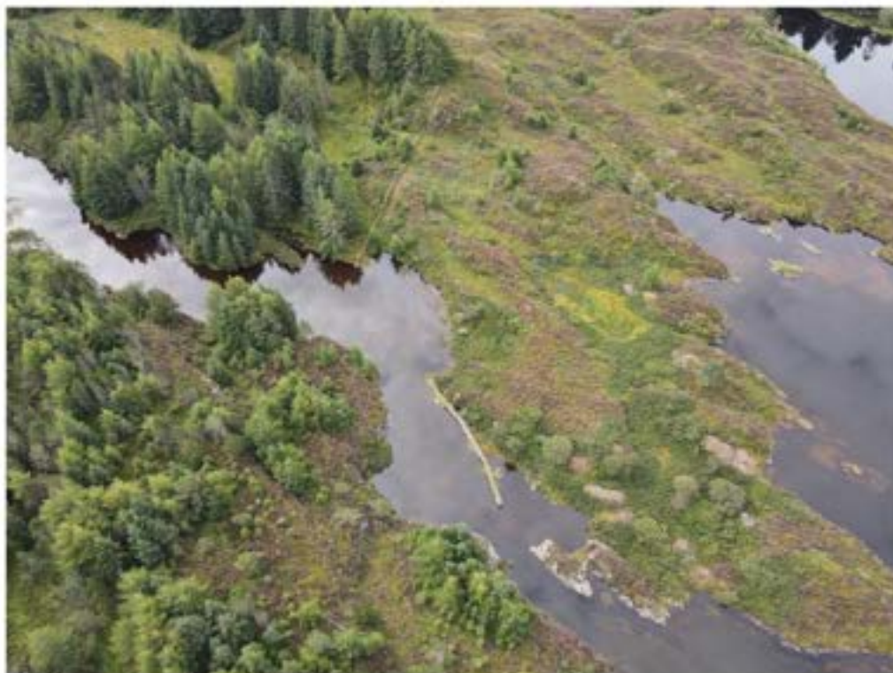
Steingardar i utmarka i Øksneset

Steingardar finn ein både i skogsdistrikta og i lyngheiområdet i Nordhordland. Desse tener som grenseskifte mellom inn- og utmark, som grense mellom teigar i innmark og som inngjerding av beiteområde. På Hjertås og Hopland er det enno spor etter desse i form av steingardar som framleis står. Njøta er også kjent for steingardane som går på kryss og tvers. Det er mange lange og fine steingardar i heile kommunen, og spesielt den i Øksneset. I Makrellvågen/Torftegård er det steinruiner etter steinkai og demning.