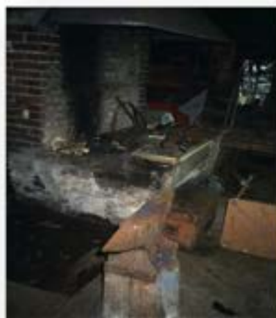
Smia på Krossøy Gbnr. 164/1

Folk hadde mykje utstyr og reiskapar av jern og stål, og det var alltid arbeid for ein smed i bygda. I byrjinga var det truleg ei attåttnæring på gardar i fleire delar av kommunen. I følge dokument ved skifte og folketeljing var det utstyr til smier på : Austrheim, Bakka, Førland, Kilstraumen, Krossøy, Kvalvågen, Leirvågen, Nyhavn/Børo Nordre Njøten, Rongeværet, Strømstad , Synnevågen, Utkilen og Årås.