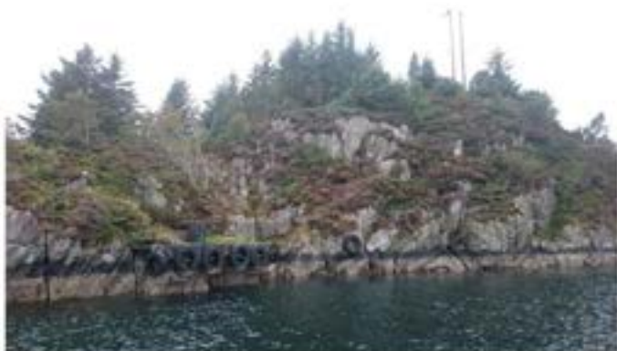
Kai med tilgang til vatn – Trollholmen i Øyaneområdet

Dette er kai til statsbrønnen ved Trollholmen. Bygd av kystverket i samband med fiske og vassforsyning til fiskebåtane. Det var mange på fiske i området under og etter krigen. Ein del høyrde til her, men det var også mange tilreisande under sildefisket . Bruken gjekk fort nedover. Sildefisket forsvann herifrå i 1950-åra. Det same gjorde brislingfisket. Også folk i Øyane henta vatn i tørkeperiodar.