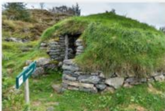
Jordkjellar i kommunalt eige – Torvneset ved snøggåtkaien

Torvneset var ein husmannsplass utan bruksnummer, men i 1937 vart det skild ut frå bruk nr.9 og fekk bruksnr. 131/31 Solvang. Jordkjellaren ligg no på bruk nr 250. Før jordkjellaren vart restaurert, hadde han eit spesielt skadebilete då mykje av det ytre var borte. Likevel er ikkje den indre strukturen øydelagt. Til skilnad frå jordkjellaren på Litlelindås vart det ikkje funne eit felt med jord mellom det indre og det ytre murverket då dette var borte i lag med mykje av jorda og torva. For å få ein solid konstruksjon, som kunne bera jord- og torvmassane som jordkjellaren skulle