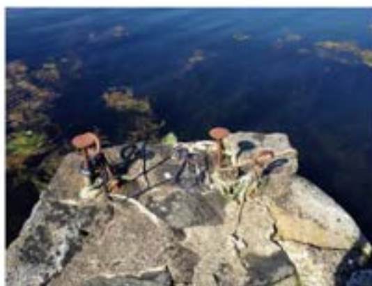
Prestekaien på Hopland

Fortøyingsbolt på sørsia av Kilstraumen, på Utkilen. Dette neset er kalla Livberget, også nemnt som Likberget, eller Likferdneset (s.354 i band 1). Det vert sagt at det var her dei tok kistene med dei avdøde for å føre dei til kyrkjegarden. Skutar forliste i den sterke straumen, eller gjekk på grunn på blindskjæret. Her på berget redda sjøfolk seg på land, og her drog dei på land dei som drukna.