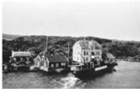
Historisk bilde av Kilstraumen på 1800-talet

Handelstaden og vertshuset Kjelstraumen er kjent frå gammal tid. Staden er eit reisemål i kong Håkon Håkonssons saga frå første halvdel av 1200-talet. I Salhus og Kvalvågen veit me at det var vertshus for å husa folk som ferdast langs den indre leia kring 1500. Men i 1610 vart gjestgjevarstaden lagt til Kilstraumen, som då var prestegods, fordi staden hadde ei gunstig plassering og gode hamnetilhøve. Dette året får staden lov til å setja opp eit hus for dei sjøfarande etter skriftleg løyve frå kong Christian IV.