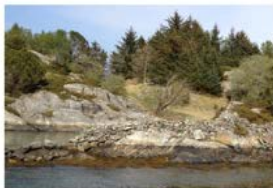
Steingard heilt til sjøs - Dyrøyna

Rydningsrøysar er menneskeskapte spor i kultur- og jordbrukslandskapet som er vanskelege å tidfesta. Men som regel er dei små rydningsrøysene eldre enn midten av 1700-talet.