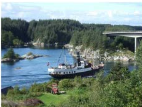
Oster på tur i Kystsogevekene - Kilstraumen

1814 markerer byrjinga på det sjølvstendige Noreg og i 1837 vart lokalt sjølvstyre innført. Ny teknologi som dampskip og telegraf førte til dramatiske endringar. Etter midten av 1800-talet tok fjordabåtane over trafikken mellom bygdene på Vestlandet. 14. november 1866 gjekk «Arne» frå Bergen til Sandnes i Masfjorden. Ein av stoppestadane var Kjelstraumen. Bergen var staden med flest dampbåtar i Noreg og kom til Austrheim ein gong i veka.