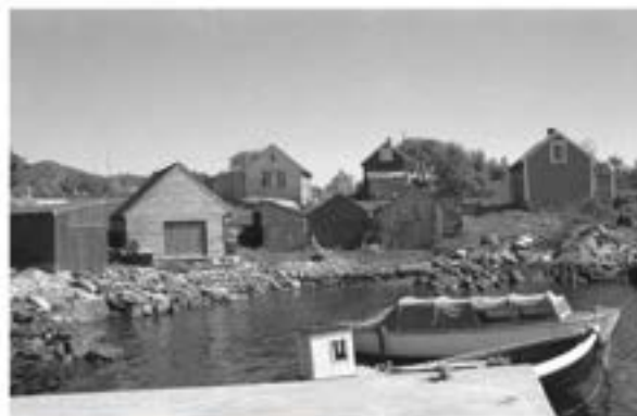
Naustmiljø Hopland rundt 1964