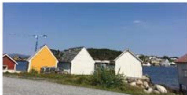
Naustmiljø i Tresvika

I Austrheim er det registrert fem bygningskategoriar i desse miljøa: Naust, notbu, sjøbu, saltebu og torvhus. I tillegg er det i seinare tid registrert eit garnhus i Sævrøyna.