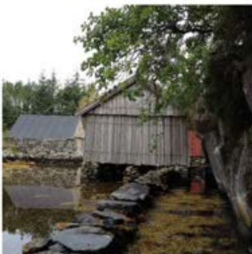
Naustmiljø - Sætrevika

Omgrepet «sjøbruksmiljø» femnar om fleire typar bygg enn «naustmiljø». I sjøbruksmiljøet finn ein ulike bygg som til dømes naust og sjøbuer, men også torvhus. Stein er ein av dei mest dominerande materiala i sjøbruksmiljøa i Austrheim. Ofte er det tale om ein kombinasjon av stein og grindverk eller det kan også vera reine grindverksbygg. I tillegg reknar ein også til dømes kaiar, lunnar og hopar til sjøbruksmiljøet. Lungrinda er eit svært karakteristisk trekk ved nausta og eit av dei mest alderdomlege trekka i slike miljø. Det er vanleg at bygningane vert restaurerte, men ikkje lungrinda og steinmurane.