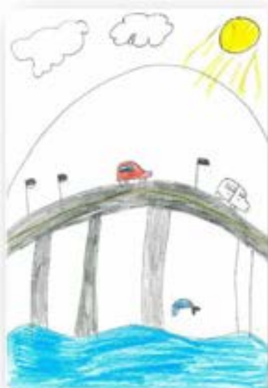
Teikning ved Elisabeth - 3a Årds skule 2021

Kulturminna og kulturmiljøa i Austrheim kan fortelje oss historier om korleis menneska før oss har levd og verka, og korleis dei har tilpassa seg naturen. For å lykkast med å skapa begeistring for kulturmiljø må vi fortelje dei gode historiene om fortida. Ønskje er at auka kunnskap og forståing om kulturminne i Austrheim, vil på sikt bidra til at fleire ser verdien av å ta vare på kulturminna/kulturmiljø. Mange kulturminne er ikkje lenger i bruk og ligg der som ruiner i landskapet. Korleis kan vi leggje til rette for at kulturminne vert teke vare på og vert formidla?