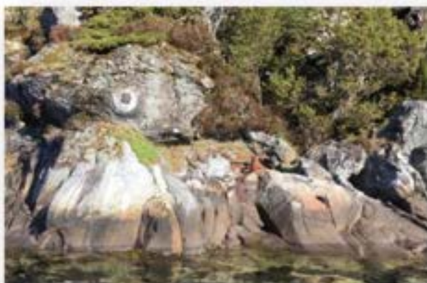
Seglingssmerke og fortøyingsbolt - Kilstraumen

Eit sjømerke eller seglingssmerke er eit fast eller flytande merke. Det er konstruert for å fungera som eit hjelpemiddel for navigasjon i kystfarvatn langs ei skipslei. Dei faste sjømerka er vardar, båker og jernsøyler, mens dei flytande kan vera lys, bøyer, bøjestakar eller vanlege stakar. Fyr er eit sjømerke med lys. Dei offisielle sjømerka er som regel merkte på sjøkart. Kystverket er dei som har ansvaret for vedlikehald av sjømerka og set dei opp.