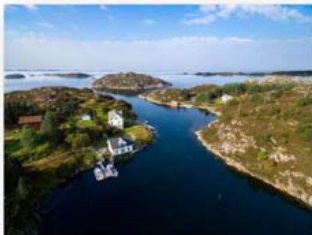
1Foto: Ola Moen - Øyane

Denne handelstaden, som også ligg ved Eikholmsundet, fekk til liks med handelstaden på den andre sida også namnet «Sundet». Det første bygget skal vera bygd opp ein gong i andre halvdel av 1800-talet.