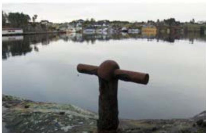
Kryssbolt uten ring

I Kvalvågen er det fortøyingsboltar på Litlestonga og på eit skjær og i følge kjentfolk meiner ein at båtar har vore fortøydd med trosse mellom desse to boltane