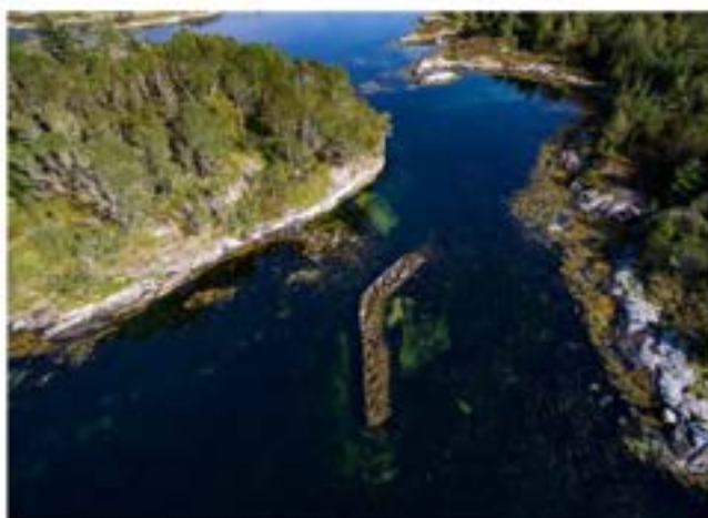
Kvalvågstraumen