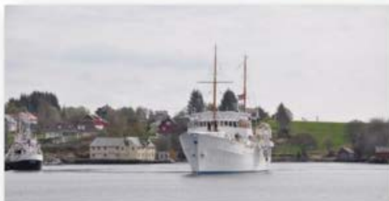
Kongeskipet i Fornesvågen 2009. Sjøbu og naust