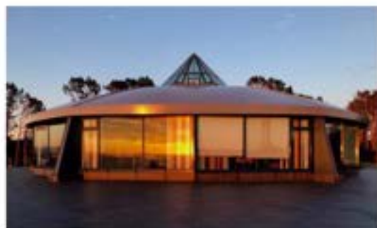
Foto: Knut Torkilsen Horvei Reiarlagkontoret til Myklebusthaug Management

Myklebusthaug Management driv i dag 16 skip, hovudsakleg eigd av forskjellige selskap innan Myklebusthaug-gruppen. Av desse er det 5 offshoreskip, 5 sjølvlossarar og 6 containerskip. Myklebusthaug Management har omlag 260 personar i arbeid, med 240 til sjøs og 20 på land. I tillegg til hovudkontoret på Fønnes har dei kontor både i Bergen og Tallinn.