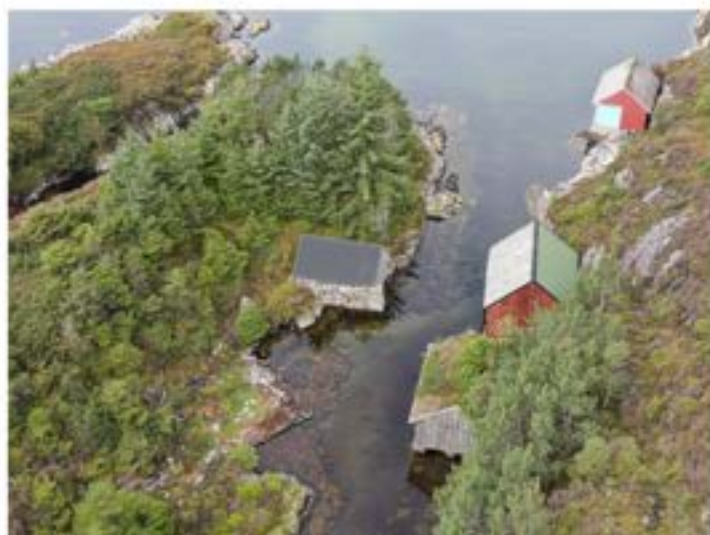
Naustmiljø - Sætrevika

I Austrheim er det registrert fem bygningskategoriar i desse miljøa: Naust, notbu, sjøbu, saltebu og torvhus. I tillegg er det i seinare tid registrert eit garnhus i Sævrøyna.