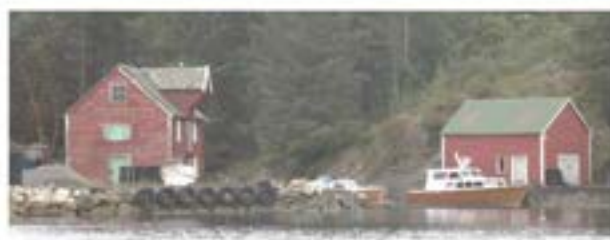
Sjøbu og naust på Austre Sævrøy