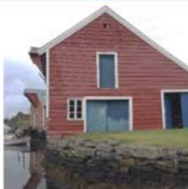
Sjøbu i Kvalvågen