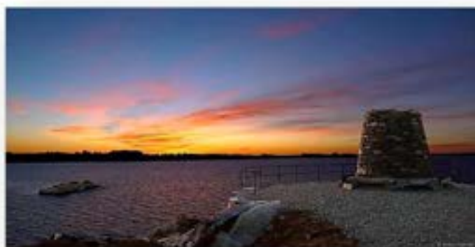
Vardetangen, den vestlegaste pynen på Noregs fastland

Å arbeida med kulturminne, identitet og sjølvforståing er ekstra viktig for folk langs kysten. Slik er det også for kystkommunen Austrheim som har Vardetangen, det vestlegaste fastlandspunktet i Noreg, og som er så tydeleg vendt mot havet. Å løfta opp og formidla kystkulturen på lik linje med dei nasjonale ikona frå fjordane og innlandet er ei sentral oppgåve i arbeidet, og særleg overfor barn og unge.