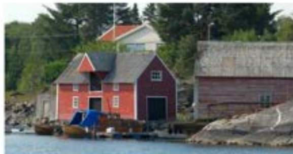
Sjøbu i Fønnesvågen