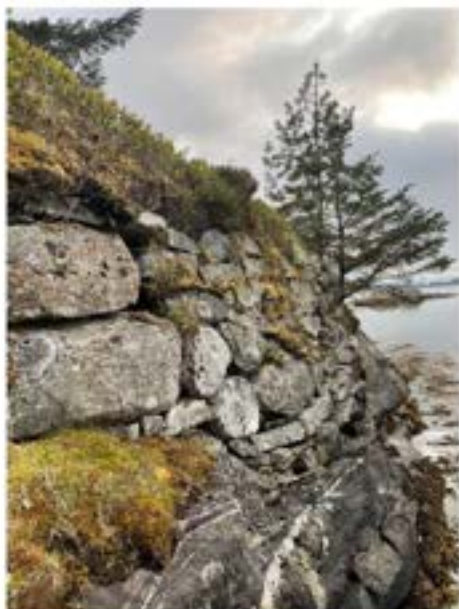
Steinmur mot sjø – på tursti Årvika-Vardetangen

dette kan vera at det er ein samanheng mellom omfattande bruk av stein og dårleg tilgang på tømmer. Men vèrtilhøva, særleg i dei ytre stroka, har sett strengare krav til byggjemateriale som verkar isolerande og som varar lenge slik ein gråsteinsmur gjer. Byggeskikken kan også koma av lange tradisjonar og lokale sedvanar. Men føremålet avgjorde kva for teknikkar ein nytta når ein la opp steinmurane. Det var også vanleg å venta med å hogga steinen til etter at han var lagd i muren.