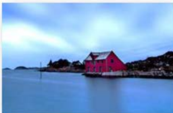
Lerøybua

Lerøy Notlag sette opp Lerøybua i 1919 og nokre år seinare vart bua utvida noko. Eigarane av Lerøy Notlag var oppsitjarane på bruk 1, 3 og 4 (gnr 158). Lerøybua vart kjøpt frå Osterfjorden og sett opp på Litle Småholmen. Holmen høyrde til bruk nummer 3. Ved sida av bua var det ei nothengje, men denne vart sett opp noko seinare enn sjølve bua. Nothengja fall ned under eit uver midt på 60-talet. Lerøy Notlag dreiv aktivt sildefiske med skøyta «Mairós» på 42 fot, gavlbåten «Vikingen» på 27 fot og notbåtane «Blomvåg»,