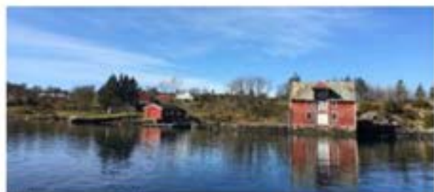
Sjøbu og naust i Måkan