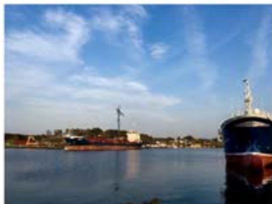
Det er framleis mange reiarar i Austrheim.