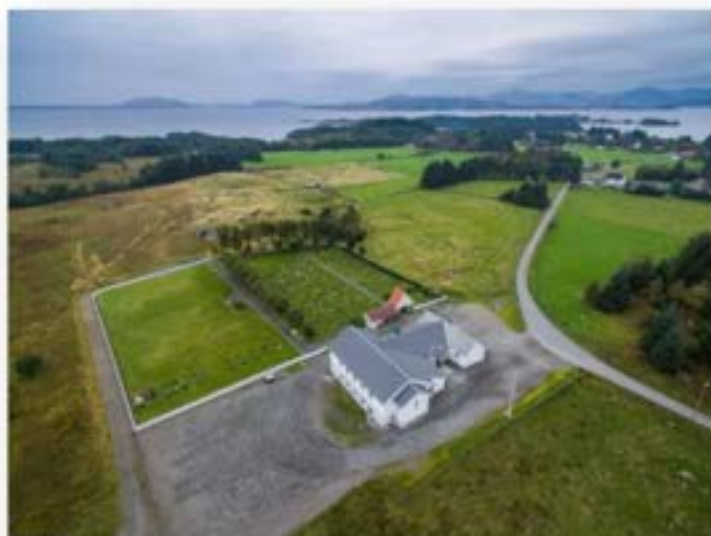
Leirvågen bedehus

bedehuset inneheld hovudetasje med ein stor sal, ein stor vestibyle, eit kjøkken, toalett og eit kontor. Denne etasjen er koplå direkte saman med det gamle bygget som er uendra. Kjellaretasjen består av ein stor sal, eit stort rom, toalett og tekniske rom.