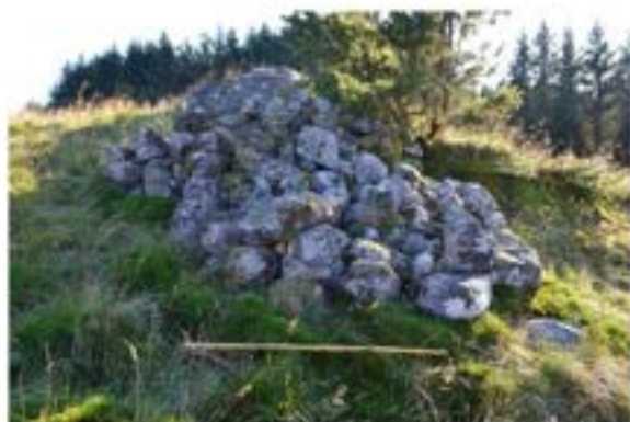
Rydningsrøys - Torvneset