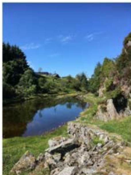
Steinsett veg – Øksnes - Rebnor