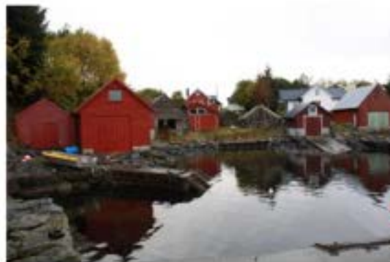
Naustmiljø Hopland 2015