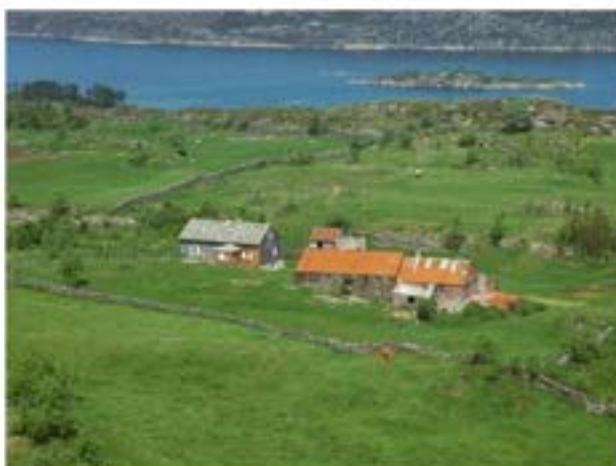
Flyfoto 1964 - Nordre Njøta

Steingardar finn ein både i skogsdistrikta og i lyngheiområdet i Nordhordland. Desse tener som grenseskifte mellom inn- og utmark, som grense mellom teigar i innmark og som inngjerding av beiteområde. På Hjertås og Hopland er det enno spor etter desse i form av steingardar som framleis står. Njøta er også kjent for steingardane som går på kryss og tvers. Det er mange lange og fine steingardar i heile kommunen, og spesielt den i Øksneset. I Makrellvågen/Torftegård er det steinruiner etter steinkai og demning.