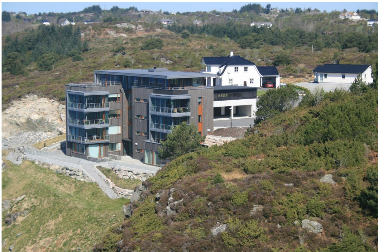
Leilighetsbygg på Storebø