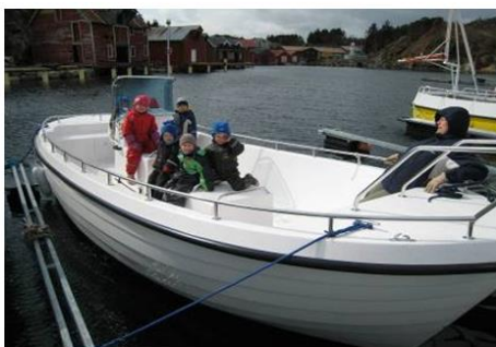
Til maritim utdanning på "Fiskerfagskulen i Austevoll"

Slik skal me fortsatt behelde posisjonen som ledande innanfor maritime næringer: